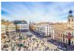
Hotel BESTPRICE Madrid Alcalá