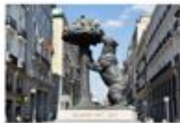
Hotel BESTPRICE Madrid Alegría