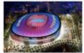
Hostal BESTPRICE Barcelona Stadium