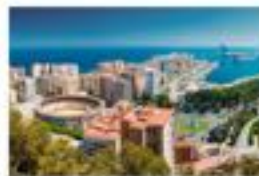
Hotel BESTPRICE Málaga Próxima apertura