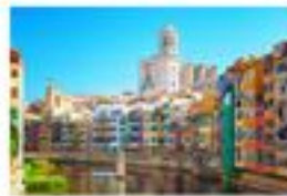
Hotel BESTPRICE Girona