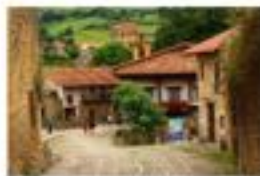
Hotel BESTPRICE Santillana del Mar