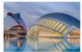
Hotel BESTPRICE Valencia