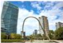
Hotel BESTPRICE Barcelona Diagonal