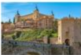
Hotel BESTPRICE Toledo