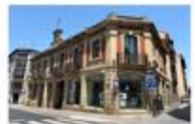
Hotel BESTPRICE Logroño Próxima apertura