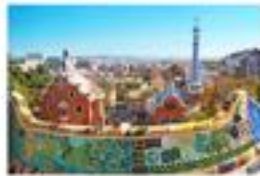
Hotel BESTPRICE Barcelona Gracia