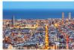
Hotel BESTPRICE Barcelona Maragall